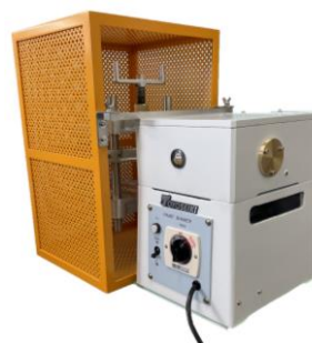
※安全カバー(標準)型式C 装着時イメージ