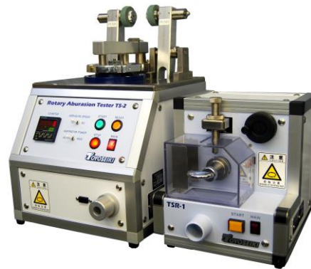
No.430 ロータリーアブレーションテスタ 型式 TS-2